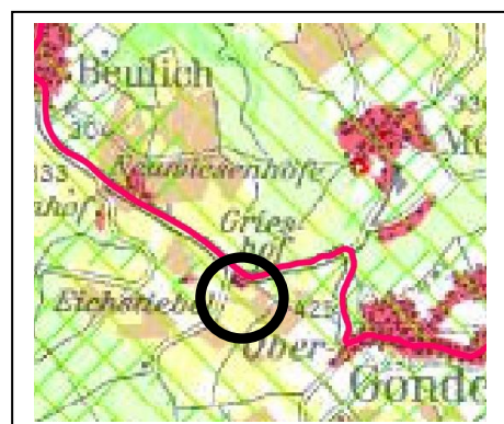
Abb.4: Auszug aus dem RROP – unmaßstäbl.

Somit entspricht die Festsetzung eines Sondergebiets Landwirtschaft und Tourismus den Zielen der Regional- und Landesplanung.