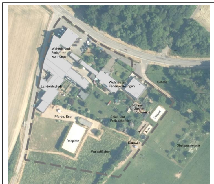
Abb.6: Nutzungen im Geltungsbereich – unmaßstäblich

Hecken und einzelne Bäume prägen die Wiesen- und Weideflächen.