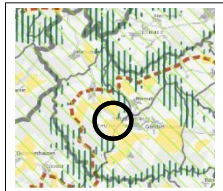
Abb.3: Auszug aus dem LEP IV – unmaßstäblich

Die Nutzung entspricht somit den Zielvorgaben des Landesentwicklungsprogramms LEP IV