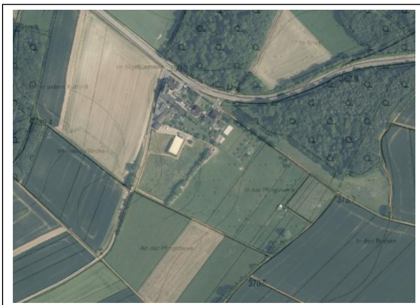
Abb.2: Nutzungsstruktur (Auszug aus LANIS RLP - unmaßstäblich)

Nördlich des Plangebietes verläuft die Landesstraße L 206. Nach Norden und Süden wird es außerdem von Wirtschaftswegen begrenzt. Östlich und südlich schließen weitere landwirtschaftlich genutzte Flächen an.