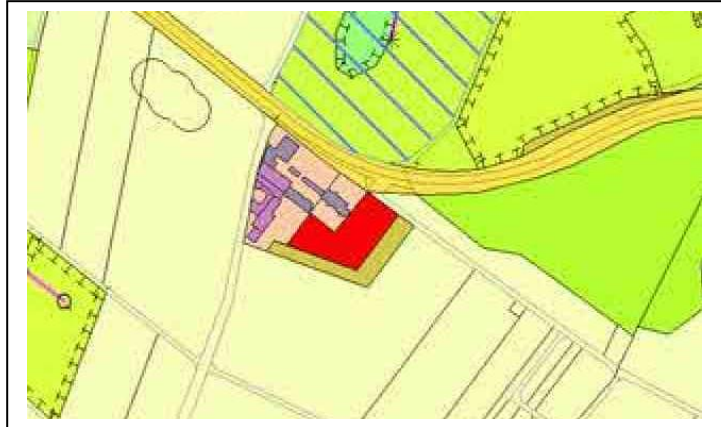
Abb.5: Auszug aus dem wirksamen Flächennutzungsplan der VG Hunsrück – Mittelrhein – unmaßstäblich

Braun: Gehölze (und standortgerecht Ufergehölze)